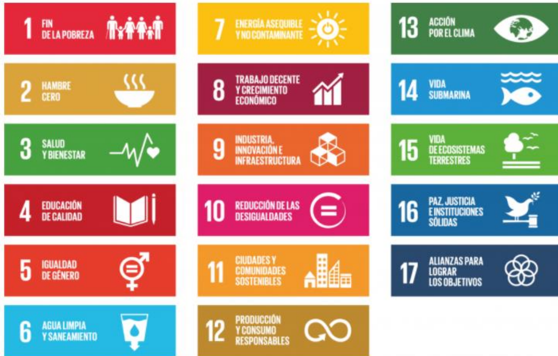
Figura 1. Objetivos del Desarrollo Sostenible